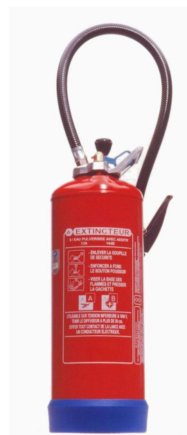
Extincteur Eau Water Extinguisher