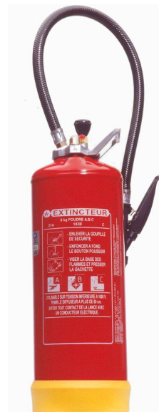
Extincteur Poudre Powder Extinguisher