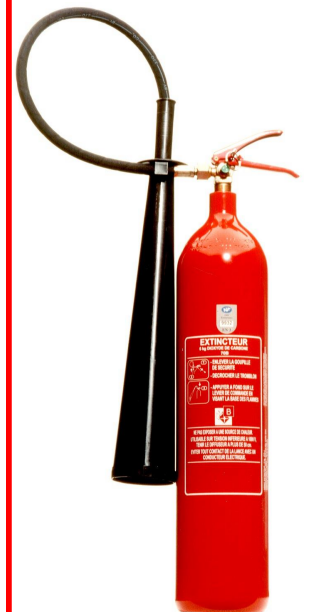
Extincteur CO 2 5 KG