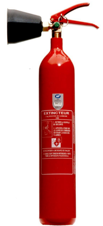
Extincteur CO 2 2 kg